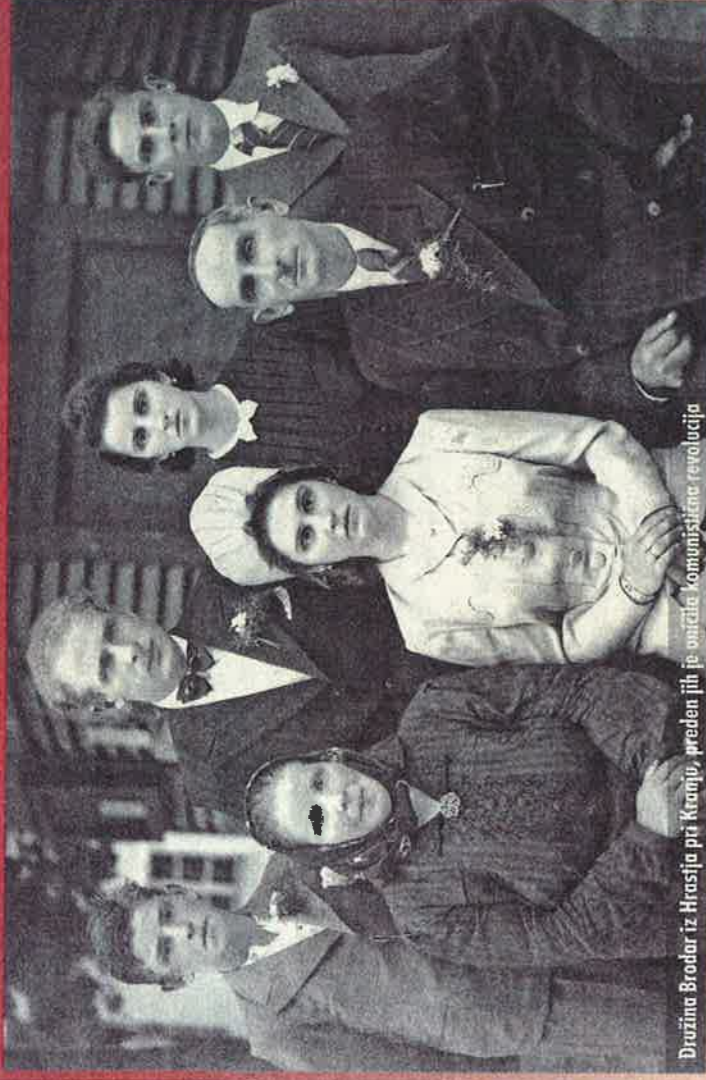
Družina Brodar iz Hrasnja pri Kranju, preden jih je onična komunistična revolucija