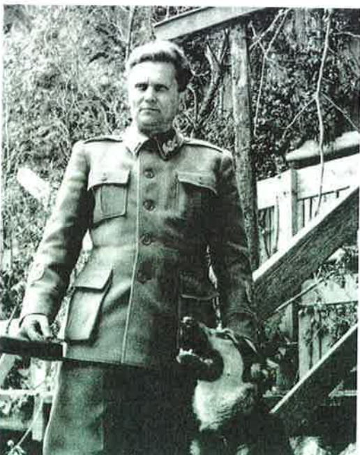
JOSIP BROZ TITO Der Kommunistenführer ließ Flüchtlinge als potenzielle politische Gegner töten

atische Heimat verlassen und Hab und Gut auf Leiterwagen geladen hatten, um die Nähe der westlichen Alliierten zu suchen. Oft waren es die Familien der Soldaten, die sich den bewaffneten Einheiten ihrer Männer anschlossen. Eine der Fluchtrouten führte über den Loiblpass (siehe Kasten).