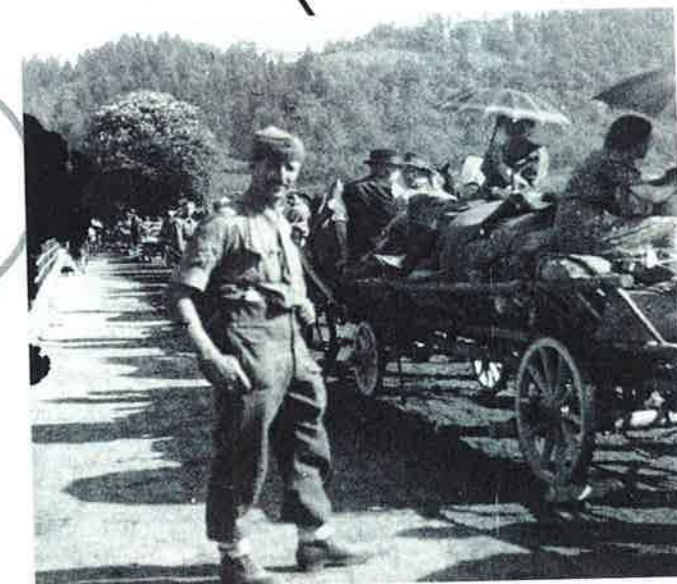
FLÜCHTLINGE AUF DER DRAUBRÜCKE Von den Briten entworfen, von den Partisanen beschossen