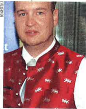
„Das eigentliche Kärntner Trauma sind diese verschwiegenen Massengräber“