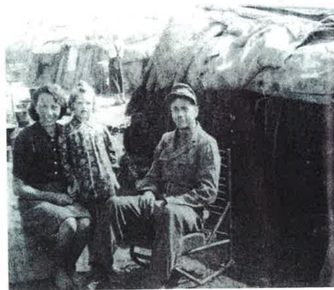
FLÜCHTLINGE IN VIKTRING In Zelten aus Ästen und Bettlaken lagerten Tausende in Viktring bei Klagenfurt