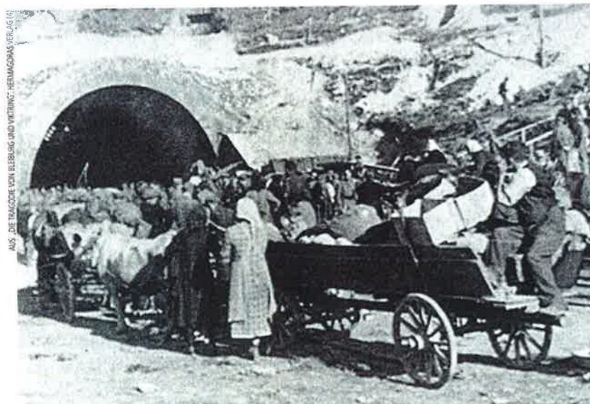
FLÜCHTLINGE VOR DEM LOIBLTUNNEL Aus Angst vor der Roten Armee und den Partisanen zogen sie nordwärts