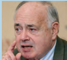
Univ.-Prof. Dr. Heinrich Neisser