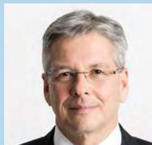
Dr. Peter Kaiser

Landeshauptmann von Kärnten / koroški deželni glavar